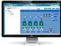
设备远程运维平台