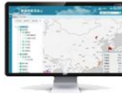
工业数据应用平台