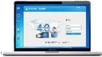
设备远程维护快线